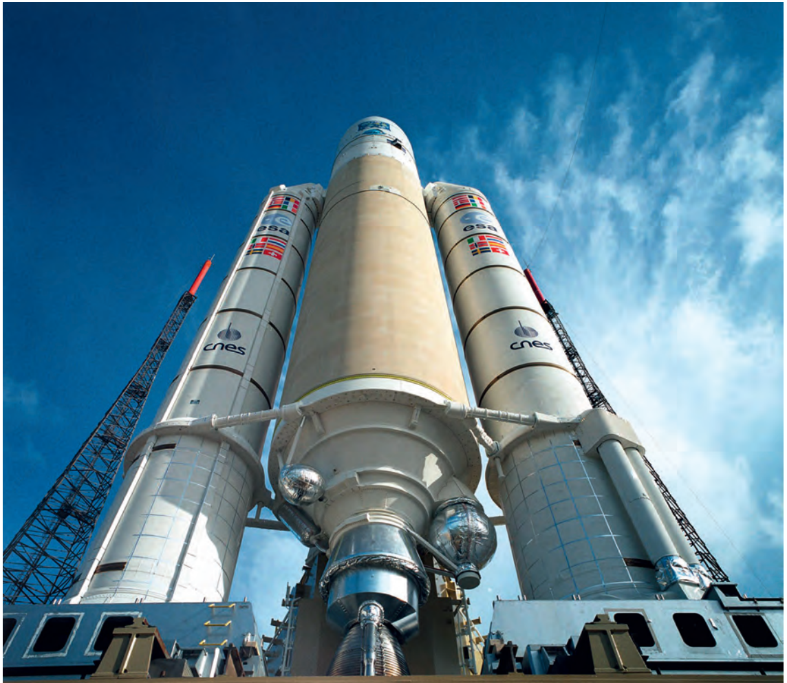
ARIANE 5 on launch pad in Kourou, French-Guiana

We do also take over a major part in the development of the new modular ARIANE 6. The future launch system is priced 40 percent less than Ariane 5 and secures Europe's and Germany's independent access to space for the future on an international extremely competitive market. As largest supplier for the European launch vehicle outside of France and service provider for the European Space Port in French Guiana, we contribute every day to the reliability and competitiveness of the ARIANE launch system.